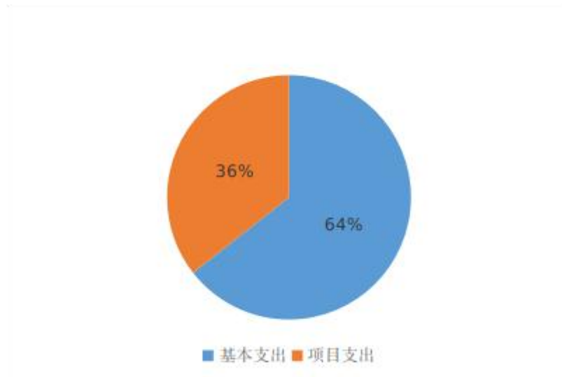
图 2：基本支出和项目支出情况