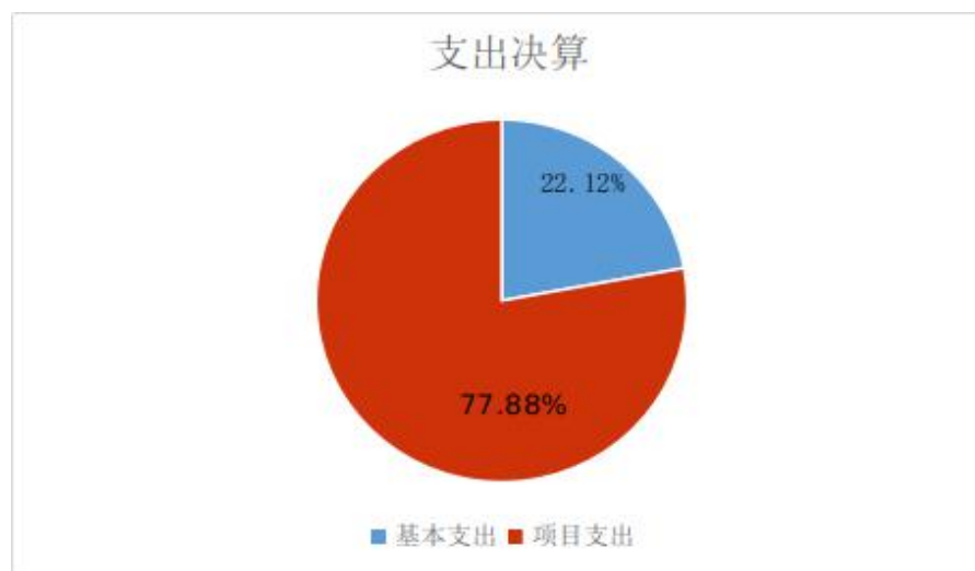
图 2：基本支出和项目支出情况

2022 年度本年支出合计 8017.29 万元，比上年减少 818.03 万元，下降 9.26%，其中：基本支出 1773.25 万元，占支出合计的 22.12%；项目支出 6244.04 万元，占支出合计的 77.88%；上缴上级支出 0.00 万元，占支出合计的 0.00%；经营支出 0.00 万元，占支出合计的 0.00%；对附属单位补助支出 0.00 万元，占支出合计的 0.00%。